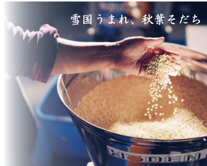
雪国うまれ、秋葉そだち