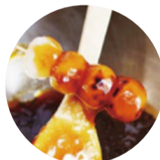
もち麦焼き団子 白雪もち麦の風味と食感を生かしたお団子

このプロジェクトは、生産から販売まで区内の各分野のプロフェッショナルが連携して取り組んでいます。年齢や職種関係なくそれぞれの「得意」を生かし、力を合わせていることが「白雪もち麦」の強みであり、皆さんに安心して口にいただけるものであると確信しています。