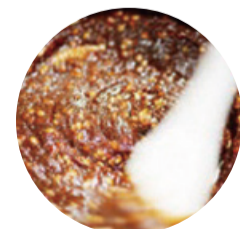
もち麦神楽南蛮味噌 白雪もち麦を混ぜ込んだ神楽南蛮味噌にバルサミコ酢を加え洋風に仕上げました