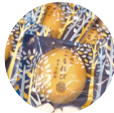
里山のこもれび 白雪もち麦を使用した生地に餡を包み込んだお菓子

秋葉区産もち麦の魅力、可能性に惹かれプロジェクトに参加しました。お菓子を通して、どのようにもち麦の良さを表現し、発信できるか、日々考えています。生産・販売・加工に携わる仲間と情報共有しながら「白雪もち麦」を広めていきたいと思っています。