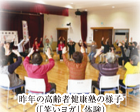
昨年の高齢者健康塾の様子 〔「笑いヨガ」体験〕