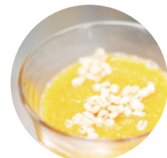
ベジフルスムージー 白雪もち麦と新潟の果物や野菜を合わせたスムージー