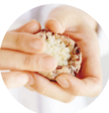
もち麦おはぎ 白雪もち麦のみを使い、甘酒で炊いたあんこで包んだ砂糖不使用のおはぎ