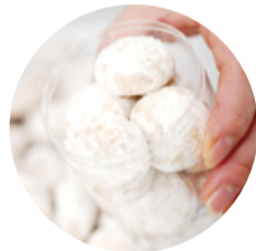
あきは十色 白雪もち麦とバター・アーモンド・きび砂糖をたっぷり使用したクッキー