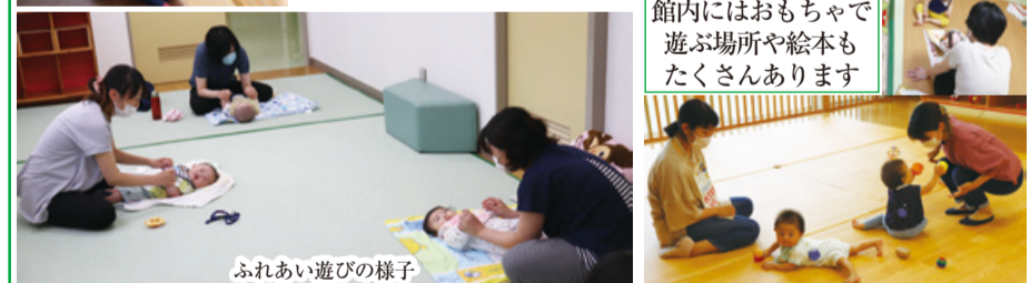
館内にはおもちゃで遊ぶ場所や絵本もたくさんあります

ベビー&ママセミナーは、3回の連続セミナーで、ふれあい遊びや助産師さんへの相談、ママたちの交流などを行っています。ふれあい遊びでは、ママとの楽しい時間に赤ちゃんたちもご機嫌でした。新型コロナウイルス感染防止のため、定員は1回3組で距離を保ちながら実施していますので、安心してご参加ください。