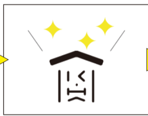
アキハスム創造活動 住む価値・場所の提案