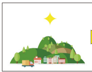
新潟市秋葉区 秋葉区の魅力を立体的にデザイン

「住む」を楽しく深める秋葉区の財産である6つの魅力「里山」「川」「食」「歴史」「鉄道」「花」を区内外へ発信して、移住・定住の促進を図ります。移住・定住者の誕生により、秋葉区の魅力がより輝きを増し、既に住んでいる人々にとっても、その魅力を再認識し、秋葉区の住人であることの誇りと喜びが生み出されることで、その土地に住む人の幸福につながるとアキハスムプロジェクトでは考えています。