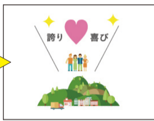
住人である誇り・喜び 秋葉区の魅力の再確認