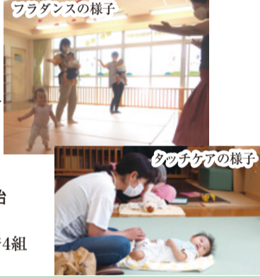
フラダンスの様子