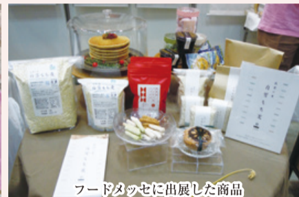
フードメッセに出展した商品