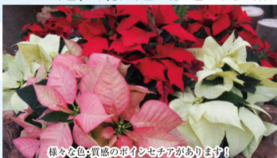
様々な色・質感のポインセチアがあります！

ポインセチアは、手頃なサイズの鉢植えで流通しますが、原産地メキシコや日本でも暖かい地方では数メートルに育つ低木です。鮮やかに色づくのは花びらではなく花を守り目立たせる「苞(ほう)」。本当の花は苞の中心に集まっている小さく黄色いつぼみのような部分です。苞の色や形は様々で、斑模様が入ったもの、ベルベットのような質感のものもあります。お気に入りの1つを見つけてみてはいかがでしょうか。