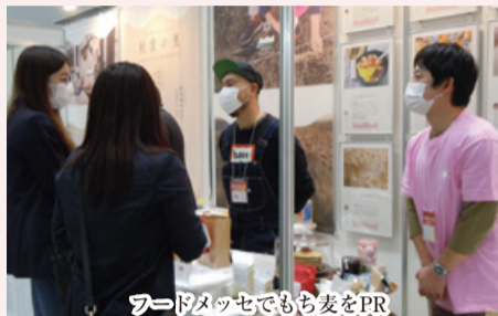
フードメッセでもち麦をPR