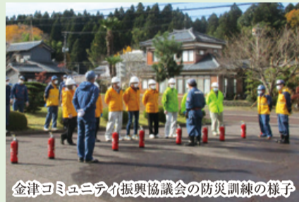
金津コミュニティ振興協議会の防災訓練の様子