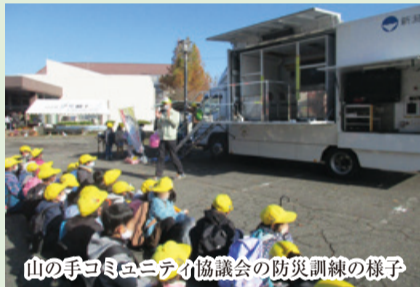
山の手コミュニティ協議会の防災訓練の様子

山の手コミュニティ協議会と金津コミュニティ振興協議会で、防災訓練が行われました。避難経路や避難場所の確認、地震車による地震体験、消火訓練などが行われました。いざという時のため、防災意識を高めることができました。