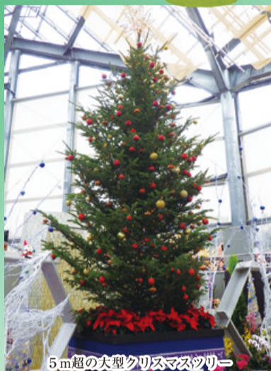
5m超の大型クリスマスツリー