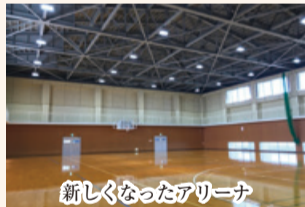
新しくなったアリーナ