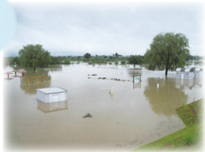
平成23年7月の新潟・福島豪雨(雁巻緑地公園)

新潟市では、洪水など災害の危険性が高まるとさまざまな方法で避難情報を発信します。防災メールやテレビ・ラジオ放送、ホームページ、巡回する広報車などで情報を収集してください。