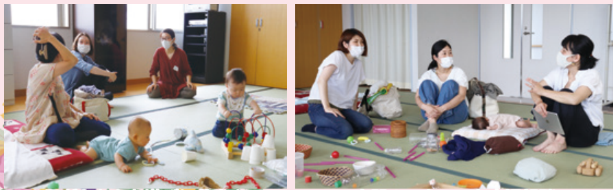
子どもたちも遊びに夢中!!