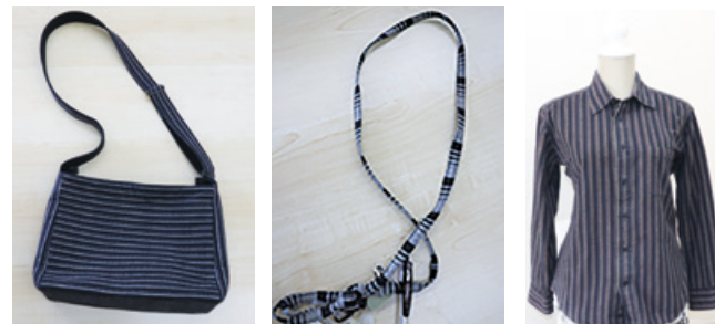
小須戸縞で作ったバッグ、ストラップ、シャツ