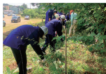
小学生の時に植樹した木の下の草刈りをしました

金津中学校では、昨年度1年生26人が朝日の森保全活動に参加しました。普段、なかなか足を踏み入れない朝日の森に関わり、金津地区の良さを再認識することができました。