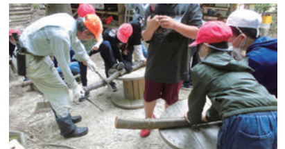
ノコギリの使い方を教してもらいながら丸太切りの体験をしました