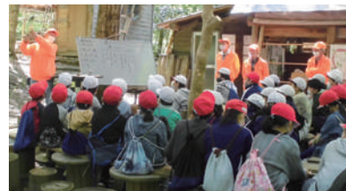
森の木や花の種類を教してもらい、季節ごとの変化を観察しました