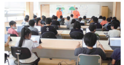
里山についての講話を聞きました