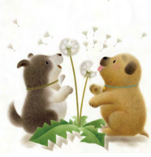
「ころわんとふわふわ」より