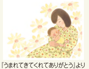
「うまれてきてくれてありがとう」より

日時 11月19日(土)、12月4日(日) 午後2時~(各回30分程度) 会場 新津美術館市民ギャラリー 定員 各回先着50人(申し込み不要、参加無料)