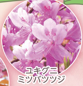
ユキグミ ミツバツツジ