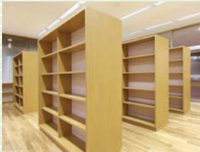
小須戸地区図書室