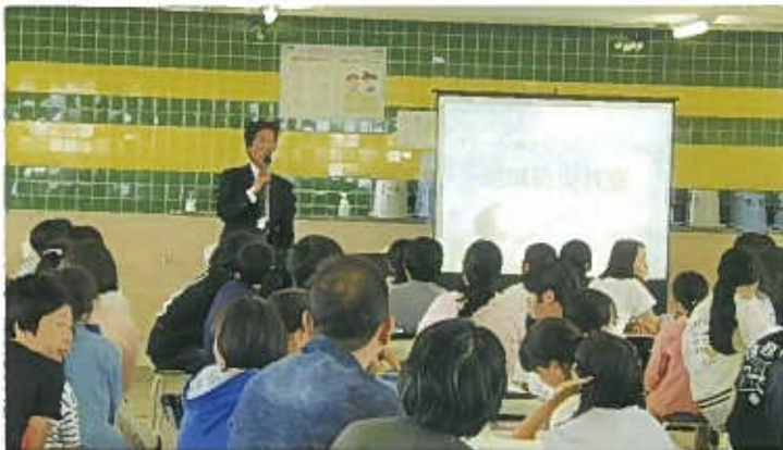
災害とは、防災とは・・・ふむふむ

講師として新津地区公民館 川近社会教育主事よりプロジェクターを使っでの防災の講話がありました。