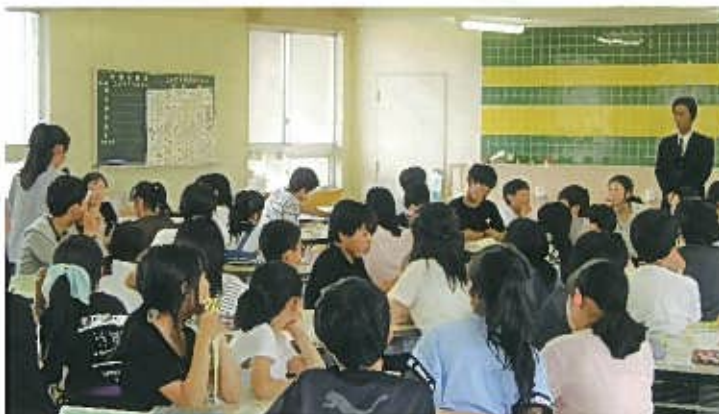
講話ありがとうございました

日頃から「家族防災会議」でルールを作っておくことが大事なので、家族で相談し、確認しておきましょう。