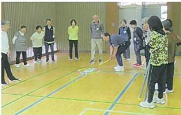
終始大歓声の熱戦が繰り広げられた