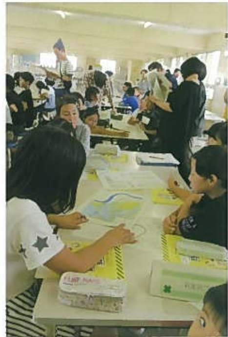
ハザードマップでなるほどなるほど

災害から自分の身を守るためには避難情報が出たら、まず安全なところに「逃げる」ことが大事。過去の災害からも「逃げる」ことで多くの命が助かることが分かりました。