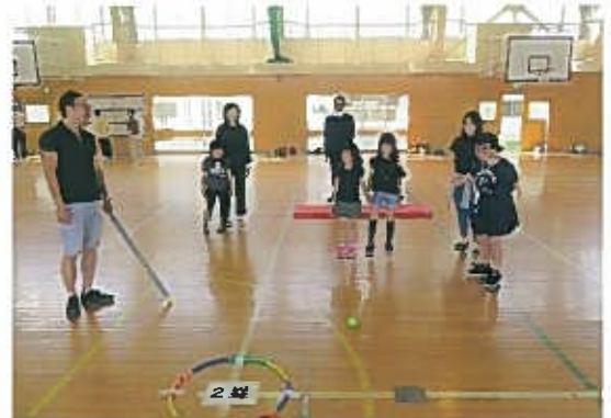
円状の塁に入れるのが大変