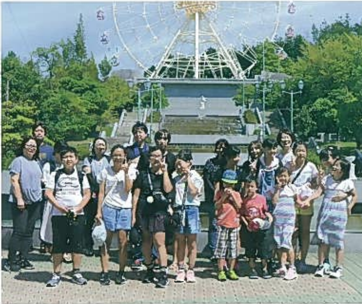
一日 とても楽しい時間を過ごすことができました。

サントピアワールドで、子供育成部主催のバーベキュー大会を開催しました。 25名の方々が参加し、天候にも恵まれ絶好のバーベキュー日和となりました。