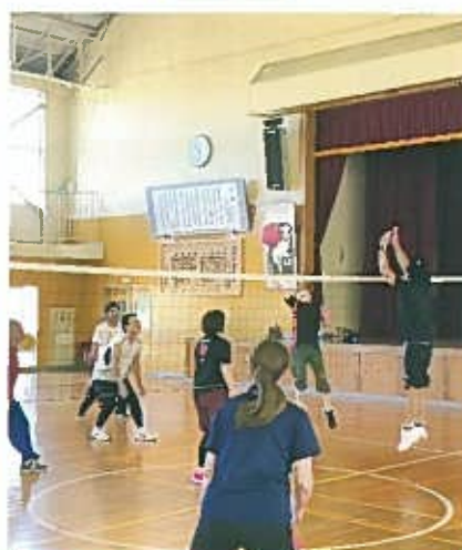
シーソーゲームの好試合

総勢38名の血気盛んな青年層を中心とし、和気あいあい、時にはハッスルプレーが出るなど、楽しいプレーが見られました。特に決勝戦では、3セットにわたるシーソーゲームで、両チームどちらが勝ってもおかしくないほどの白熱した好試合で盛り上がりました。