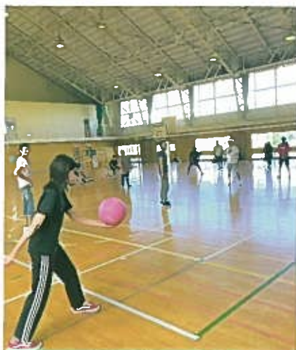
3位決定戦のサーブ