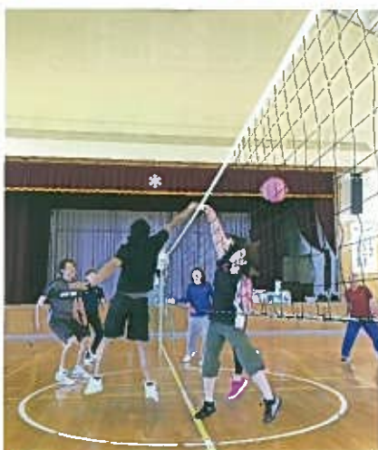
ネットぎわの攻防