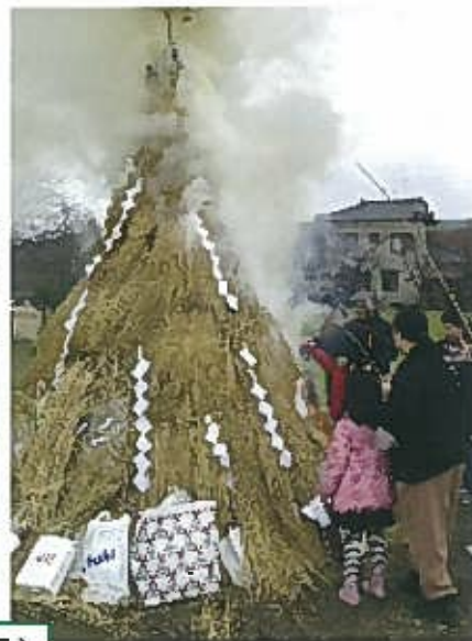
中新田の賽ノ神（R2.1.12開催の様子）