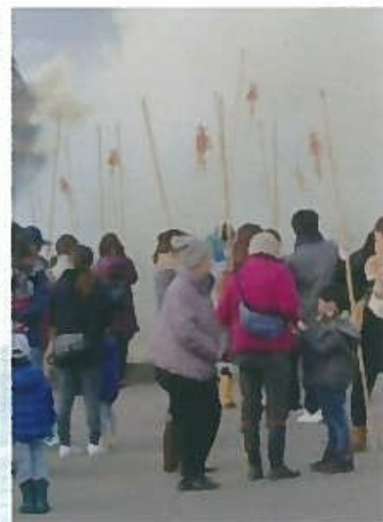
新津東町の賽ノ神