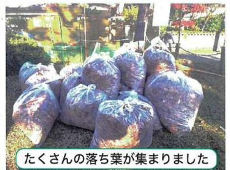
たくさんの落ち葉が集まりました