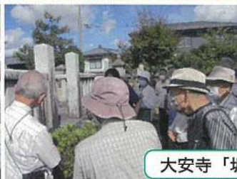
大安寺「坂口家墓所」