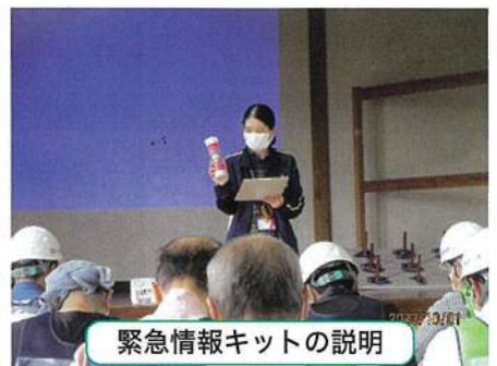
緊急情報キットの説明