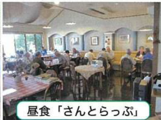
昼食「さんたらっぷ」