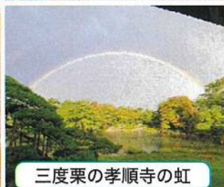
三度栗の孝順寺の虹