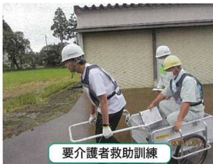
要介護者救助訓練