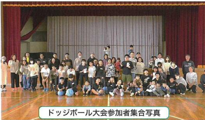
ドッジボール大会参加者集合写真

子ども育成部の事業が4年ぶりということもあり、どのくらいの方から参加していただけるかわからず、不安の中、準備を進めましたが、当日は70名近くの方々に参加していただき、同じ地域の親子で交流を持ちながら楽しんでドッジボールをすることができました。開会式にて、コミ協についての説明も簡単に行うことで、参加者にはコミ協について多少でも知ってもらえたのではないかと思います。優勝は新津東町となりました。コミ協の役員の方々、阿賀小学校のご協力を得て無事に終えることができ、とても感謝しております。来年度以降も、子どもたちやその親が楽しめる事業を継続して開催していきけるように引き継いでいきたいと思ひます。