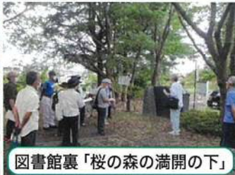
図書館裏「桜の森の満開の下」