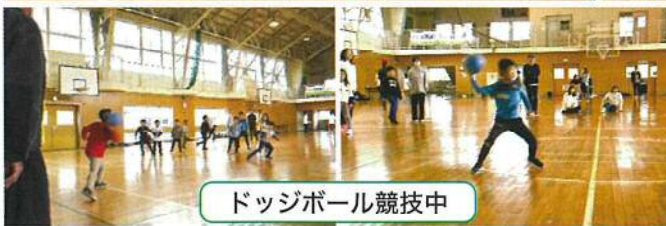
ドッジボール競技中