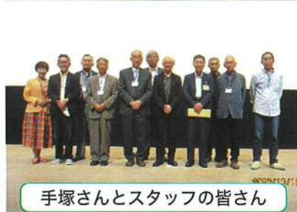
手塚さんとスタッフの皆さん