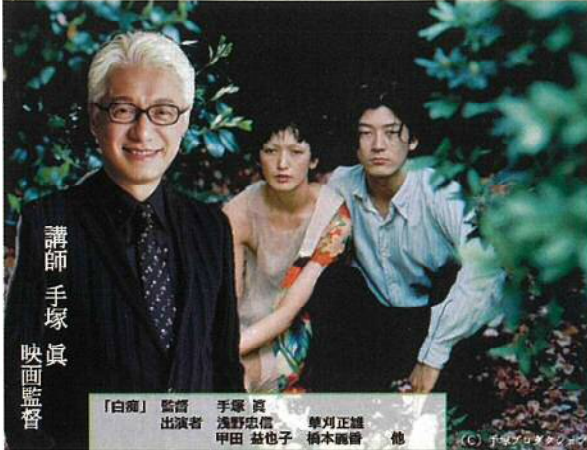
講師 手塚眞 映画監督