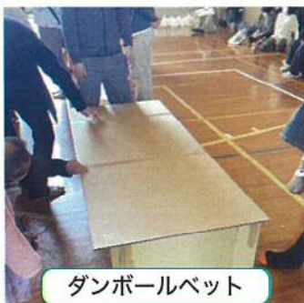
ダンボールベット