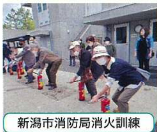
新潟市消防局消火訓練

午後からは、西方寺の逆さ竹、梅護寺の数珠掛桜(春にはまた、来訪したい)と八房の梅は、残念ながら雨には見舞われましたが、最後の、三度栗の孝順寺には奇跡の二重の虹が見られ、紅葉になり始めの斎藤家の建築に惚れ惚れでした。