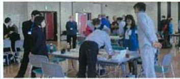
熱気ムンムン 会場内!