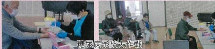
糖尿病予防大作戦