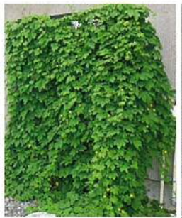
新津第一小学校 取組 3