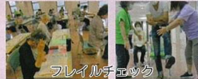
フレイルチェック