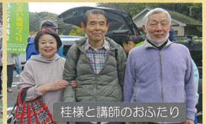
桂様と講師のおふたり