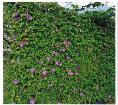
新津第一小学校 取組 1