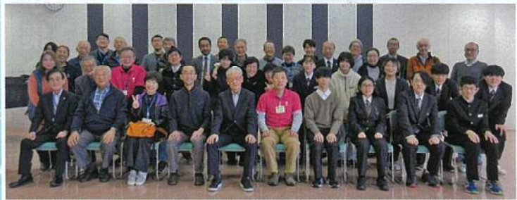
中央地区31名、心をひとつに!

老若男女・年齢差を超えてのグループ討論や発表で、目を輝かせる真剣な姿に感動しました。