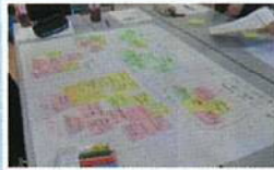
僕たちこのように考えます