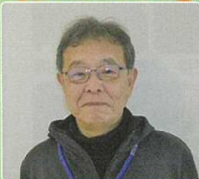
統括責任者 (副会長)