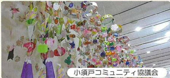
小須戸コミュニティ協議会

「秋葉区ひな・お宝めぐり」は、6つのコミュニティ協議会でも開催されました。レンズを通してカラフルで個性的な吊るし飾りを見ると、それぞれのほっこり感が伝わって来ました。おひな様グッズなどにも、各コミ協が持つ独自性や方向性が表現されていました。次回が楽しみになりました。