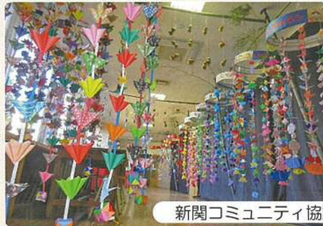
新潟コミュニティ協議会