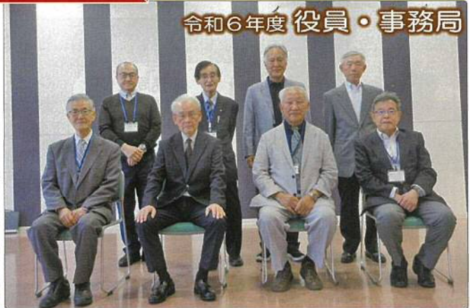
令和6年度 役員・事務局