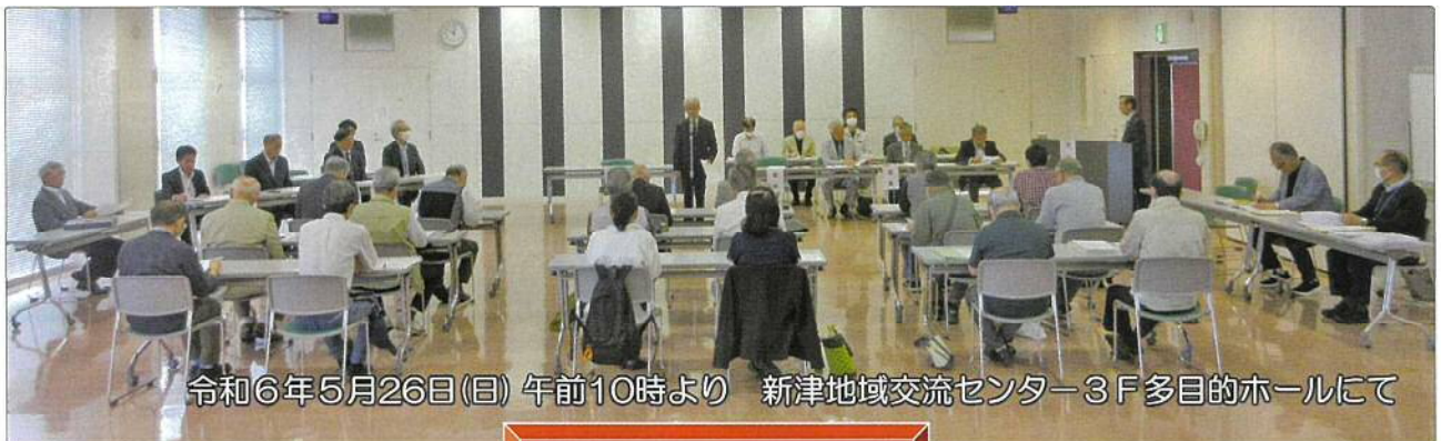
令和6年5月26日(日) 午前10時より 新津地域交流センター3F多目的ホールにて