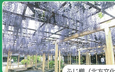
ふじ棚 (北方文化博物館)