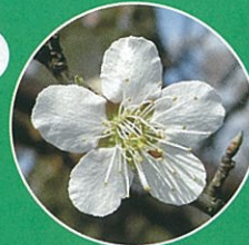
梅の花めぐり (亀田)