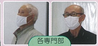
各専門部 活動報告