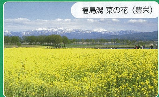
福島潟 菜の花 (豊栄)