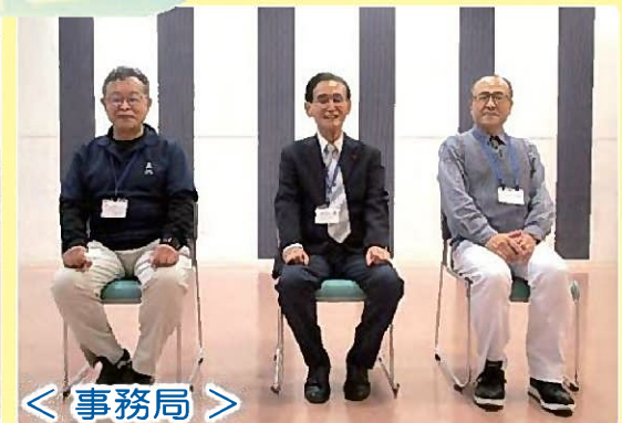
< 事務局 >