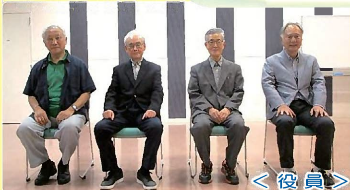
< 役員 >