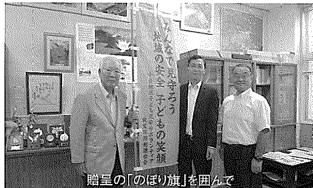
贈呈の「のぼり旗」を囲んで

小合東小学校・小合小学校では、PTA、自治会、育成会、コミ協と連携した登下校時の「子供見守りボランティア」を昨年からは活動しています。本活動を更に効果的に進めるため「防犯のぼり旗」を作成しました。 コミ協から申請し秋葉区防犯連(秋葉警察署生活安全課)より補助金が認められ、学校小中三校へ12対贈呈しました。通学路に掲揚し、これからの防犯意識の向上に役立つ事を期待しています。