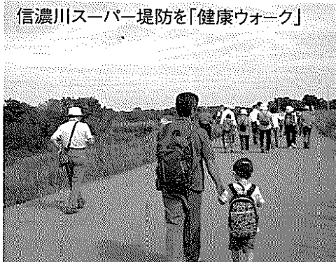
信濃川スーパー堤防を「健康ウォーク」