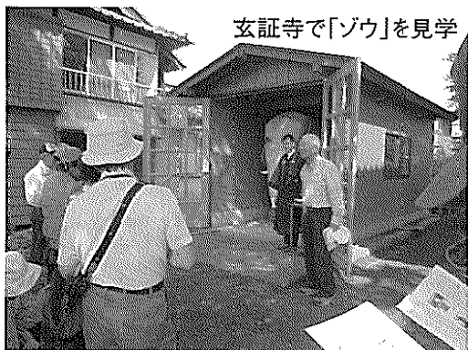
玄証寺で「ゾウ」を見学

当日は、天候に恵まれ、参加者は子供達も含む30名で、最初はマイクロバスを利用してコミセンから出発しました。