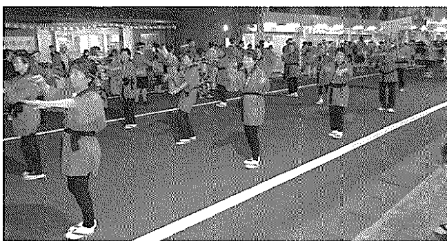
「花のふるさと小合」と書かれたハッピーで踊る