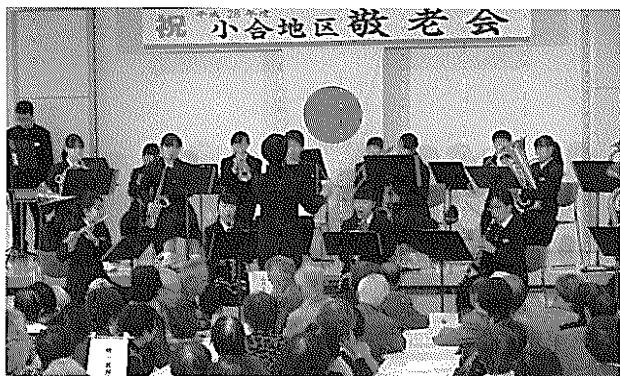
祝 小合地区敬老会

式典終了後は、各自治会の有志の方の踊りや歌、コミ協利用の方々のアトラクションがあり、会場を盛り上げました。