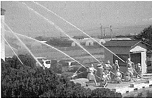
放水訓練(小合小のプール脇)