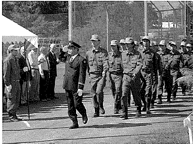
消防団 団員の皆さんの行進