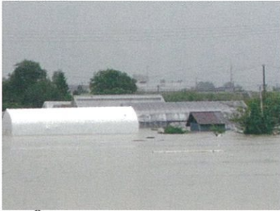
平成23年8月の水害で、 信濃川堤外地が浸水し、 大きな被害を受けた。