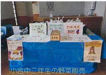
小合中二年生の野菜販売