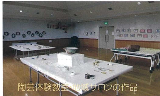
陶芸体験教室 地域サロンの作品