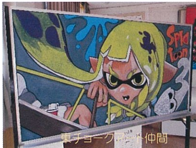
東チヨーク・仲間

11月6日(日)午前10時より午後3時まで全館を利用して開催いたしました。地域の皆様から、生け花や盆栽、工芸品や写真などの出品。そして、小合東小学校・小合小学校・小合中学校の皆さんの作品、小合中学校体育祭の紅軍・蒼軍フラッグ、二年生が一生懸命育てたサツマイモの販売も大好評で完売しました。地域サロンの皆様からも出品していただきました。