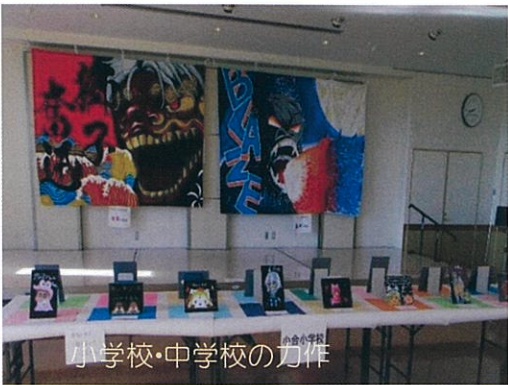
小学校・中学校の力作