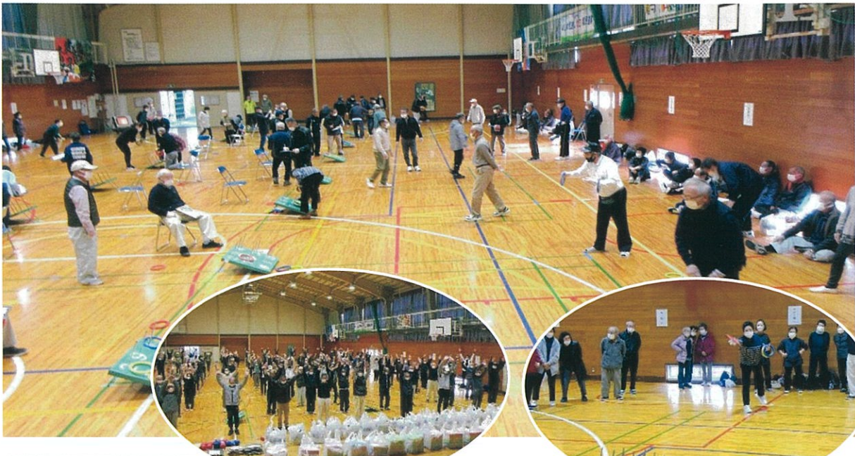
全員参加のラジオ体操