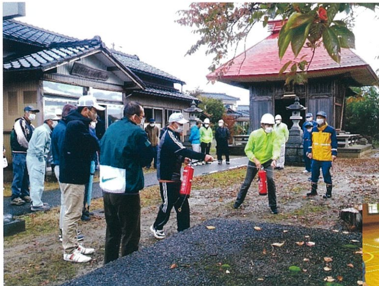
水消火器を使った初期消火訓練

今回は、震度6強の地震発生を想定し、自治会・町内会指定の一時避難箇所での訓練を実施しました。万が一の災害に備え、避