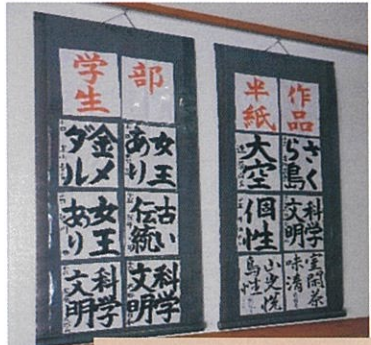
小合書道教室作品