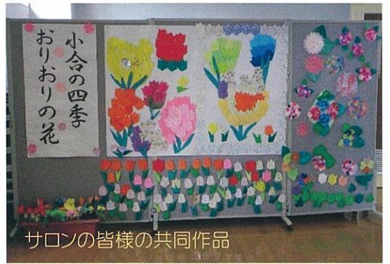
サロンの皆様の共同作品