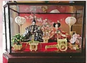
カフェゲオルク様