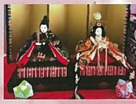
にいつフード小須戸店様