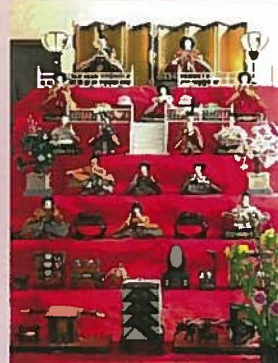
ナカムラ洋装店様