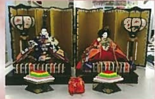
JAさつき小須戸支所様