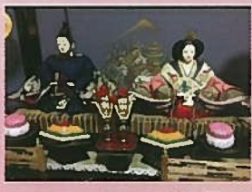
ヘアサロンモリタ様