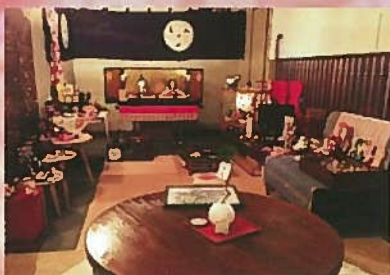
ダイニングバー404様