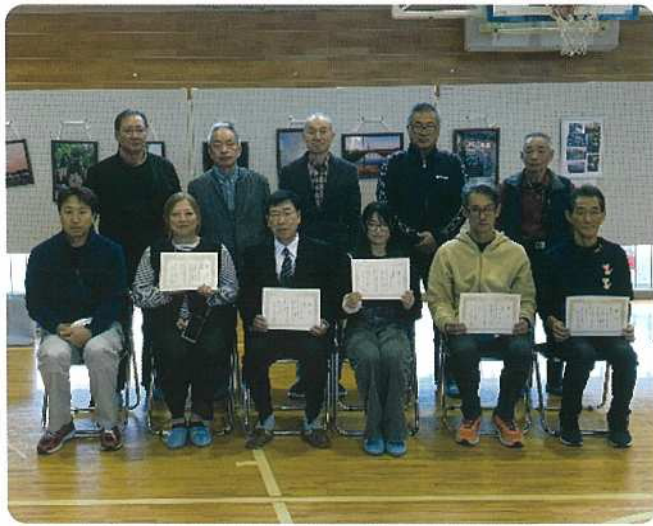
満日フォトコンテスト表彰式(R7.11.1)

令和7年11月1日(土)、満日地区文化祭オープニングで、表彰式が行われました。大賞1名、優秀賞4名、満日賞2名が表彰されました。地域の8つの会社から協賛金をいただきました。令和8年度も、バージョンアップをして第2回フォトコンテストを開催する予定です。