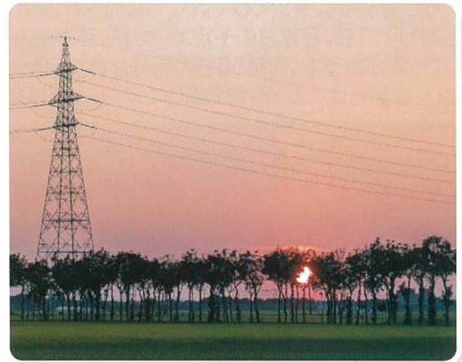
大賞 陽に映えるはさぎ並木(大田博之)