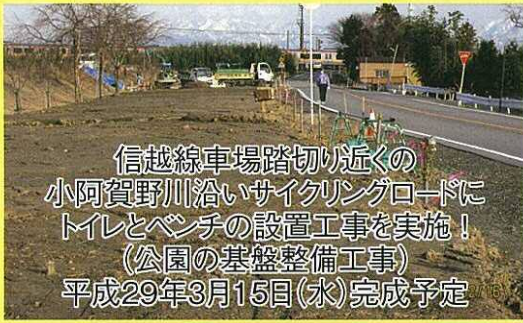
信越線車場踏切り近くの 小阿賀野川沿いサイクリングロードに トイレとベンチの設置工事を実施！ (公園の基盤整備工事) 平成29年3月15日(水)完成予定