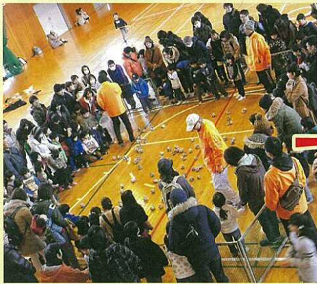
位置について～、よーい。