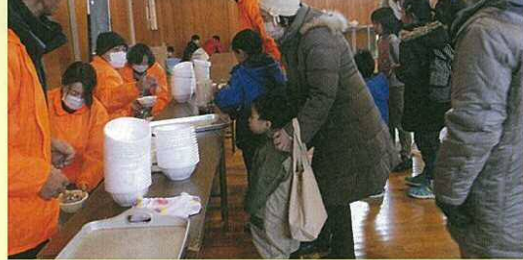
400人分用意していたどん汁は、あっという間になくなりました。