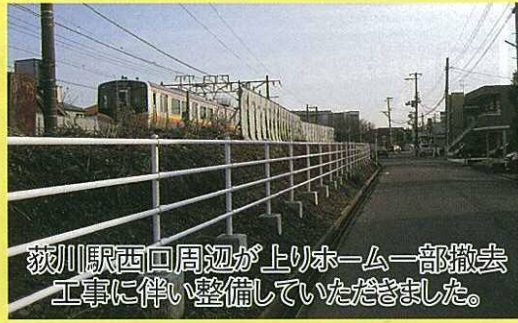
荻川駅西口周辺が上りホーム一部撤去 工事に伴い整備していただきました。