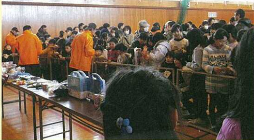
みんな真剣に当たった数字を聞いています。

二月五日(日)に第十七回荻川ちびっ子雪まつりが開催されました。 今年は残念ながら雪は解けてしまいましたので、コミセン体育館での開催になりました。今回もたくさん親子連れが参加し、皆楽しくすごすことができました。 (保健体育部)