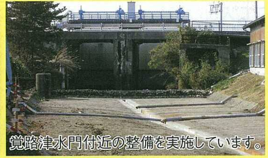
覚路津水門付近の整備を実施しています。