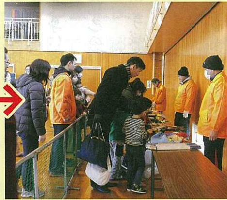
お宝を見つけたら好きなものと交換してね。