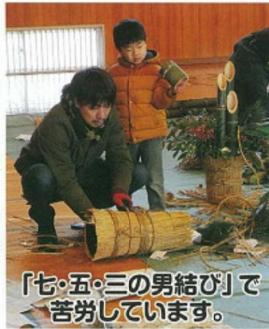
「七・五・三の男結び」で苦勞しています。