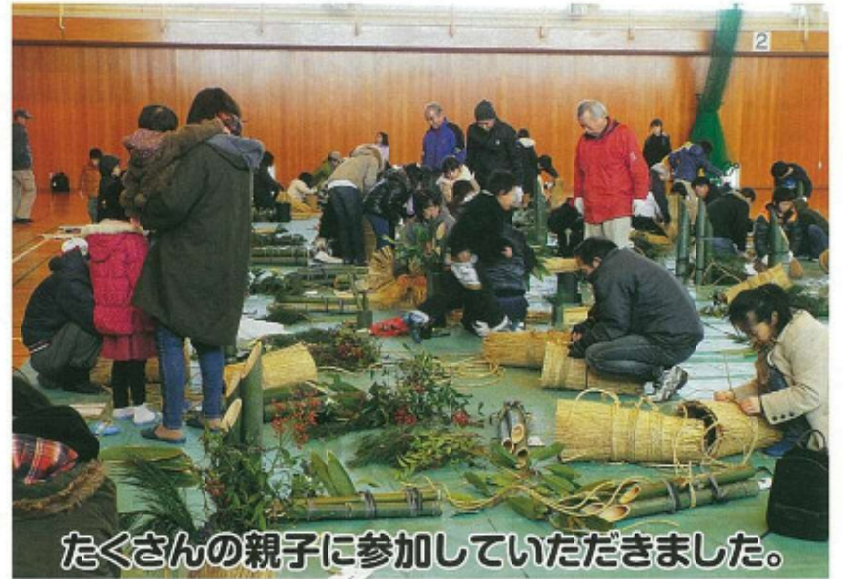
たくさんの親子に参加していただきました。