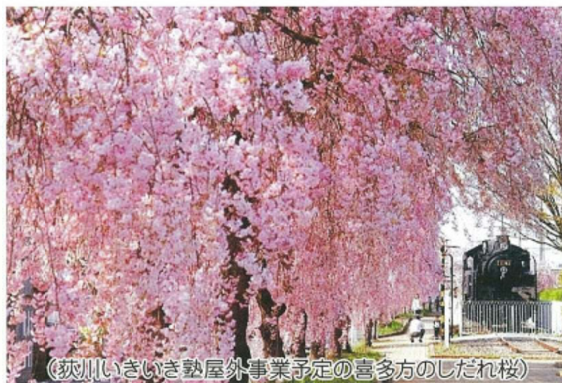
(荻川いきいき塾屋外事業予定の喜多方のしだれ桜)