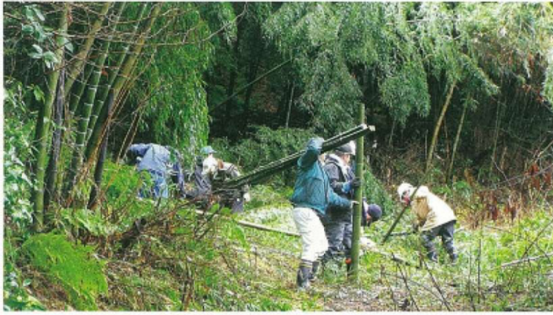
材料の竹取りから～