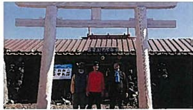
山頂「浅間大社奥宮久須志神社」