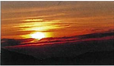
9合目よりの「御来光」

16:30 新七合目(2,700m)到着。今日の宿である「御来光山荘」到着。ここまでの行程の感想。足下が軟弱と岩場を乗り越えるので体力を使う。これからまだまだ難所が予想されるので、体力の回復を考え早めの就寝。23時頃突然の「火災警報」飛び起きるも「誤報」との事で一安心。予期せぬ事で起こされたことで山頂までの厳しい行程を考え、出発の準備をする。