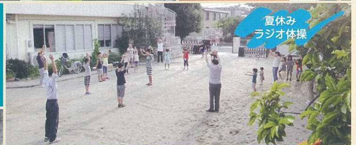
夏休み ラジオ体操