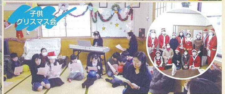
子供 クリスマス会

南町2区は(株)総合車両製作所と県道新津〜白根線にはさまれた地域で、1・2・3世帯、320名程が生活する小さな町内です。昭和41年に旧下山谷から独立し「南町」が誕生、今年で創立55年になります。また、南町1区には最近できたイオンスタイル新津、JRAパート等があります。 昭和33年から40年まで、旧新津市と新潟県住宅供給公社による住宅付宅地分譲が行われました。町内の半数近くがこの分譲によるものですが、現在は建て替えが進み、当時の面影はありません。区役所にも近く、周りに数件のスーパーもあり、生活するにはとても便利です。 昨年来のコロナ禍で、町内行事を簡単に行える状況ではありませんが、例年ならば春の側溝清掃・草取り、夏休みラジオ体操、敬老会、防災訓練、クリスマスことども会、新年会等を行っています。 当町内は高齢化が進み、独居世帯も多く、災害時の避難について、町内に支援を求め家庭が年々増加しています。災害時の「自助」「共助」「公助」。共助を進めるうえで、町内会の役割はとても重要です。これからも町内の皆さんのコミュニケーションを大切に、安心して暮らせる町内になりたいと考えています。 また、最近子供さんの数が増えはじめ、小学生で30名を超え、嬉しい限りです。一日も早くコロナが終息し、楽しい子供行事ができることを願っています。