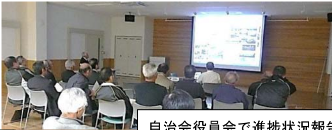
自治会役員会で進捗状況報告

「新関地域のマップ作り」に着手して何か月か過ぎました。この間、スタッフ一同は地域の皆さんや新関小学校、おひさま保育園など多くのご協力を得ながら精力的に資料集めや編集作業に取り組んできました。その結果、ようやく全体像が見えてきました。3月初めには完成にさせたいと、詰めの作業に取り組んでいます。