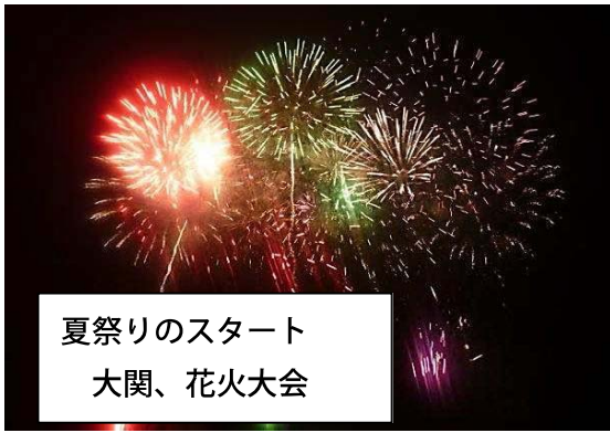
夏祭りのスタート 大関、花火大会