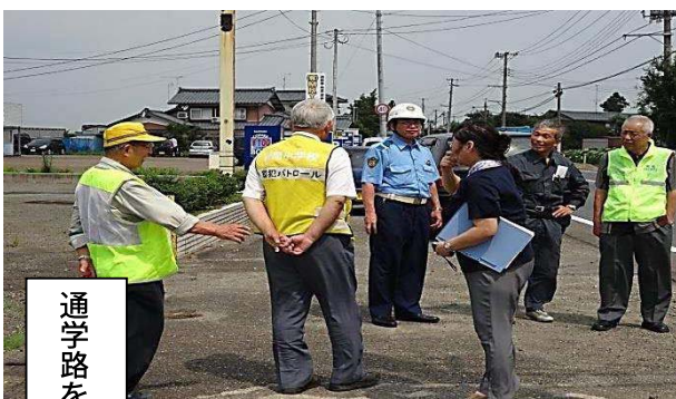
通学路を中心とした点検調査実施