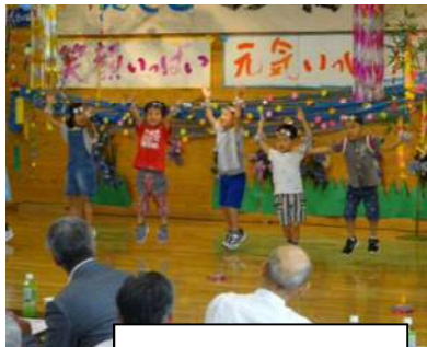
保育園児に激励されて