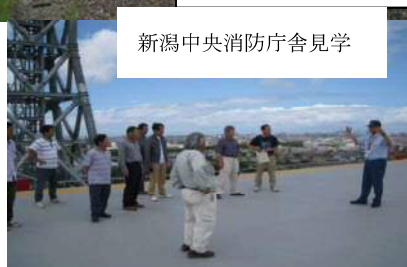
新潟中央消防庁舎見学