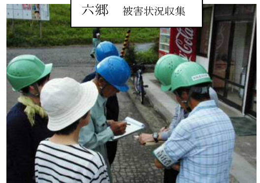
六郷 被害状況収集