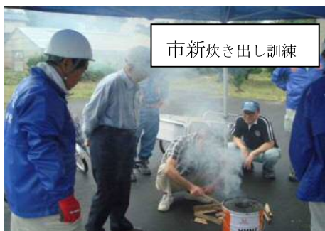
市新炊き出し訓練