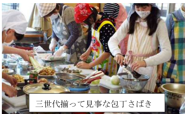
三世代揃って見事な包丁さばき