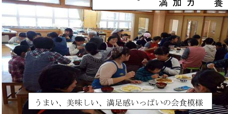
うまい、美味しい、満足感いっぱいの会食模様