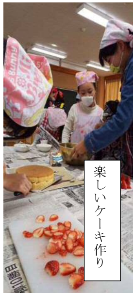
楽しいケーキ作り