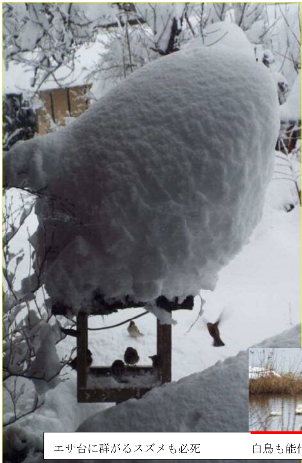
エサ台に群がるスズメも必死