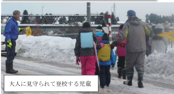
大人に見守られて登校する児童