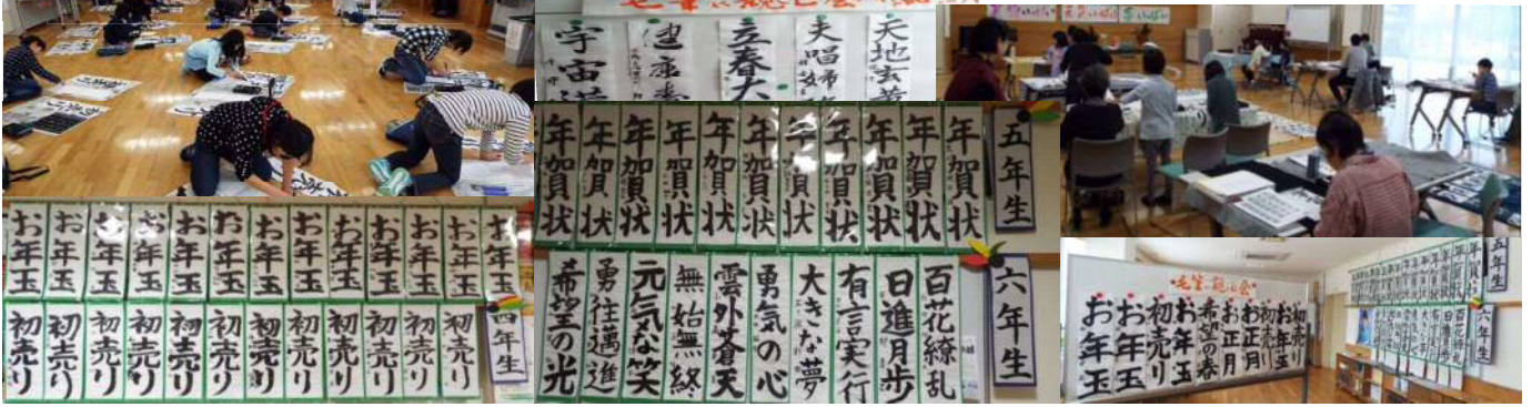
作品は新関コミュニティセンターに掲示しています。