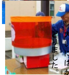
大いにはかどりました。

前日は、大勢の地域ボランティアさんから手伝っていただきました。お陰さまで準備作業は