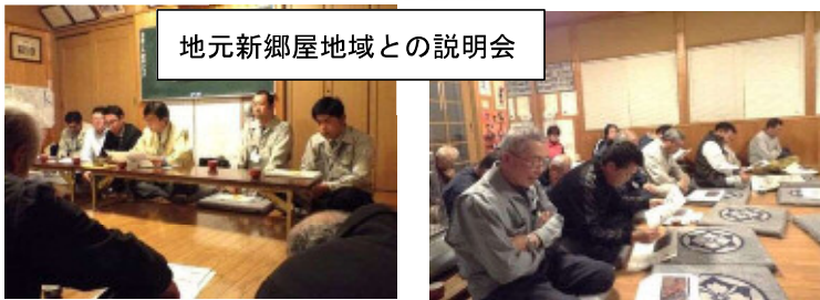
地元新郷屋地域との説明会