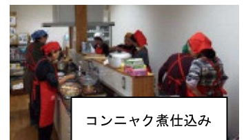
コンニャク煮仕込み