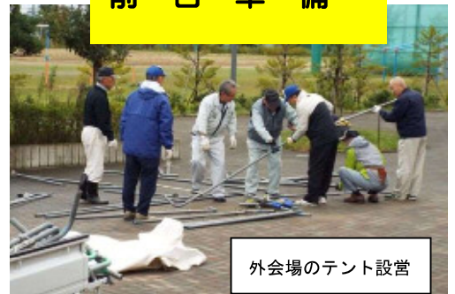
外会場のテント設営