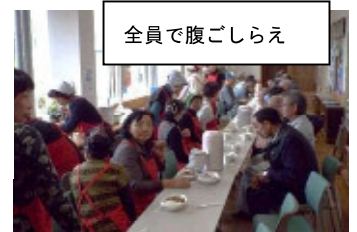
全員で腹ごしらえ

前日は、大勢の地域ボランティアさんから手伝っていただきました。お陰さまで準備作業は