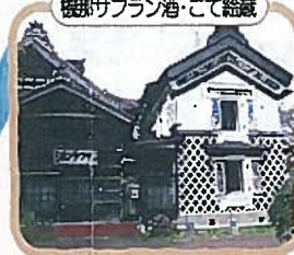
機那サフラン酒・こて給蔵

今年度の「史跡巡り」は長岡方面に決まりました。日時は9月2日(月)。醸造の町撰田屋を中心に見学します。