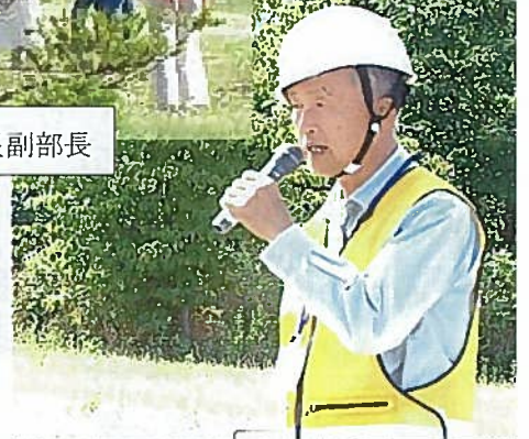
新潟地震の体験を語る間防災部長