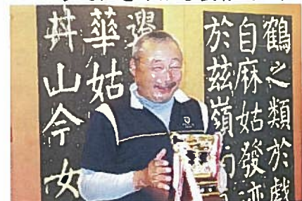
比金さん：コミ協杯を手に満面の笑み