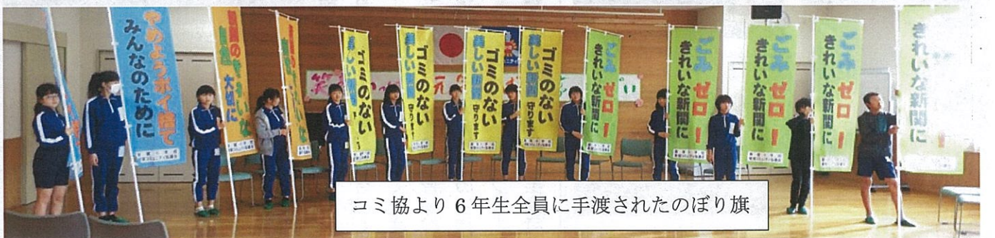
コミ協より6年生全員に手渡されたのぼり旗

新関小学校では、地域の文化遺産や自然、食文化、農業など「しんせき夢マップ」等を活用しながら「総合的な学習の時間」に取り組んでいます。毎年6年生は、6年間の学びの総集編として「新関の魅力、課題、願い」などをまとめ発表してきました。