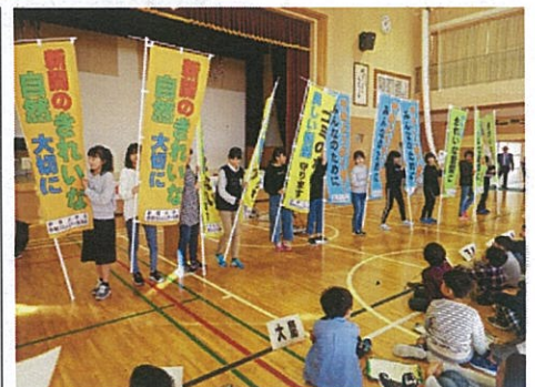
全校児童や防災教室で訪れた地域の方にお披露目する6年生

ドライバーによるポイ捨てが後を絶ちません。今後街頭に立ってアピールしたりクリーン作戦などで活用したりする予定です。