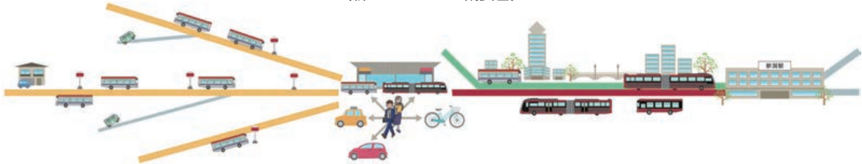
〔新バスシステム概要図〕

まちなかにふさわしい質の高いサービスを提供するBRT（Bus Rapid Transit）とバス路線再編による「新バスシステム」を事業者とともに進め、持続可能な公共交通体系の構築を目指します。