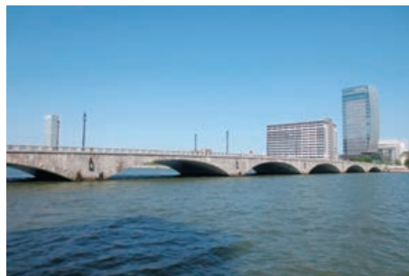
〔本市を代表する景観 萬代橋しなの川〕

美しく個性的で魅力あるまちづくりを目指し、優れた景観を「まもり、そだて、つくり、つたえる」ため、景観法に基づく「新潟市景観計画」と「新潟市景観条例」、屋外広告物法に基づく「新潟市屋外広告物条例」を定め、総合的・計画的に景観形成を推進しています。さらに、市内各地域において、それぞれの歴史と文化を活かした「修景」や「きめ細かなルール作り」を市民・事業者と一体となって取り組んでいくことで、市民共通の資産である新潟らしい景観の形成に取り組んでいます。