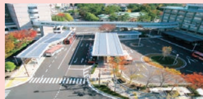
〔市役所ターミナル〕

上屋や防風壁を設置し、移動距離を極力少なくするなど、利用者の負担を軽減しています。