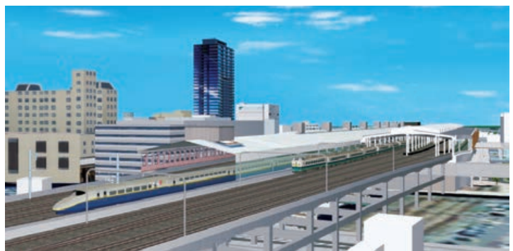
連続立体交差事業 (新潟駅周辺整備事務所)