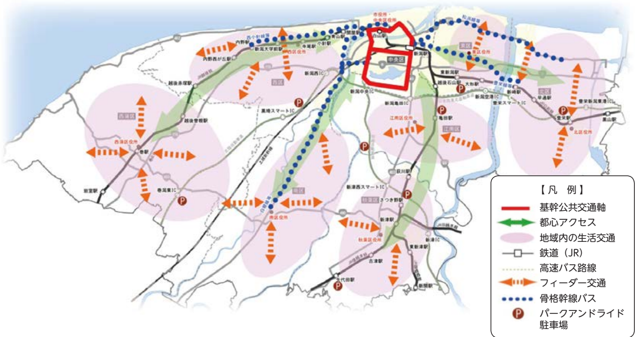
〔新潟市がめざす公共交通ネットワークイメージ図〕

田園に包まれた多核連携型都市を目指し、新潟らしいコンパクトなまちづくりを推進するため、交通体系の充実により地域間連携を強化するとともに、地域のニーズや人の移動特性等を考慮した公共交通の利用環境整備に取り組んでいます。