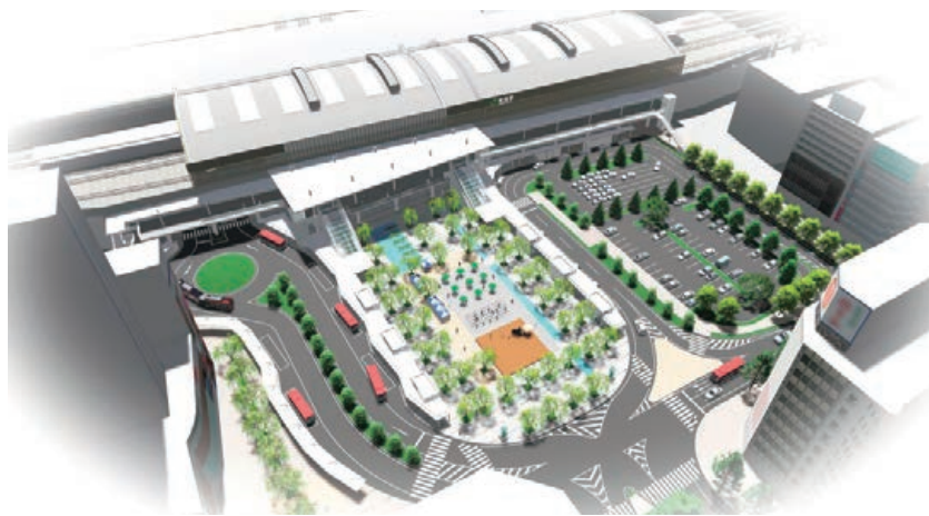
万代広場 (今後の検討・協議により変更する可能性があります)