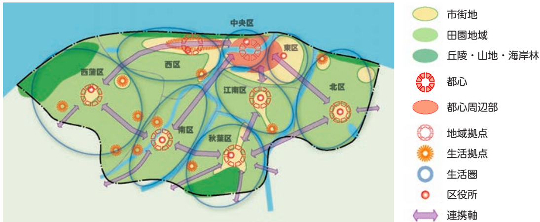
図 都市構造概念図

平成29年3月には、新潟市立地適正化計画を策定し、まちなかに望まれる都市機能や良好な居住環境の形成に向け、適正な土地利用を緩やかに誘導するための取組方針が示されています。