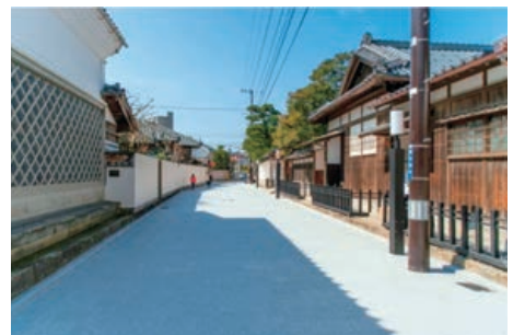
〔景観計画特別区域 旧齋藤家別邸周辺地区〕