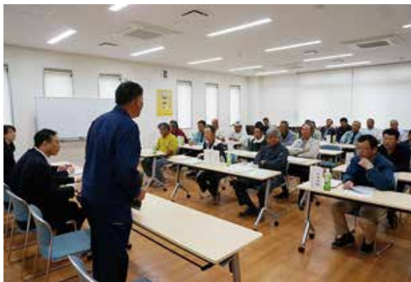
赤塚地区：JA新潟みらい西グリーンセンター