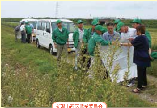
新潟市西区農業委員会

7・8月は前期月間として現地調査(利用状況調査)を中心に、10・11月は後期月間として補充調査を実施し、利用意向調査発出前の再確認を行います。