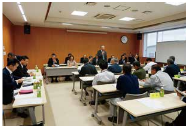
黒埼地区：JA新潟中央黒埼支店

5月8日から西区内5カ所の会場で、地元農業委員及び農地利用最適化推進委員同席により、農業委員会業務の説明を行いました。はじめに委員会業務全般及び29年度事業方針について、次に農業経営基盤強化促進法による農地の賃貸借について、耕作放棄地対策について、農地転用について説明を行い、農家の皆様から質疑や農業施策に対するご意見をいただきました。