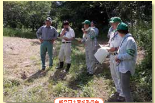
新発田市農業委員会