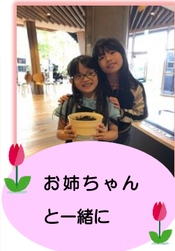
お姉ちゃん と一緒に