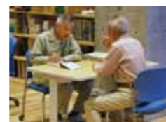
園芸相談コーナー 食育・花育センター1F