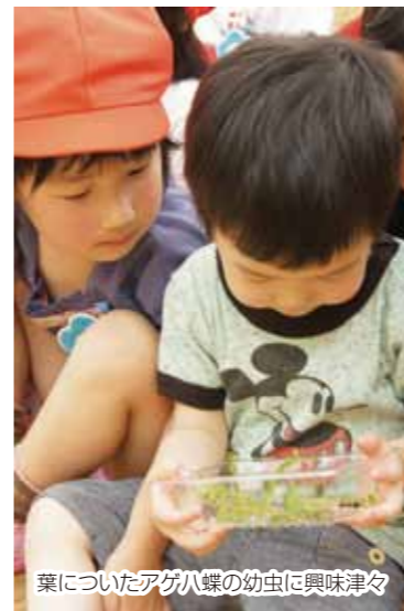
葉についたアゲハ蝶の幼虫に興味津々

いくとびあ食花では、各施設の特色を活かした体験プログラムを提供しています。今回は、ごく身近にある草花を使っての簡単な遊びを体験。大人にとっては懐かしい遊びでもあります。幼い頃の草花遊びの思い出は、将来貴重なものになることでしょう。