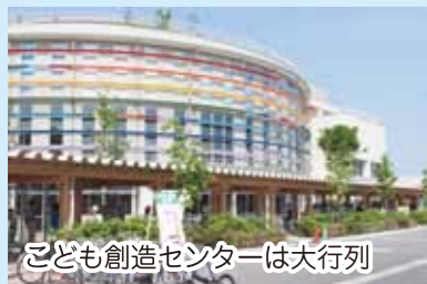
こども創造センターは大行列

愛称が「いくとびあ食花」に決定した、食と花の交流センターエリアに2つの施設がオープンしました。食育・花育センターも合わせて3施設でオープニングイベントを開催し、多くの市民でにぎわいました。