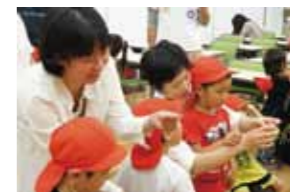
親子で一緒にチャレンジ、遠くまで飛ばせるかな?