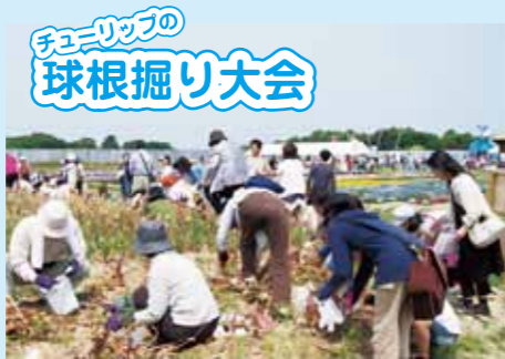
チューリップの球根掘り大会