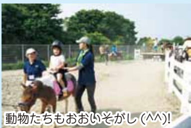
動物たちもおおいそがし(^^)!