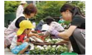
いつもこの公園で遊んでいるというひまわり保育園の園児も参加。