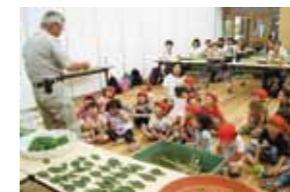
スキの葉が飛行機になるんだよ。