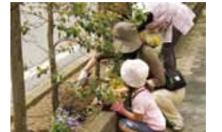
植え替えたピオラを捨てずに再利用して道路脇に植えました。