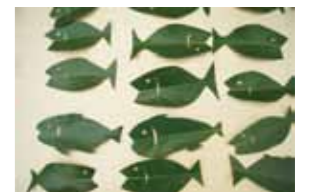
最後に、シイの葉で作ったおさかなをみんなにプレゼント。