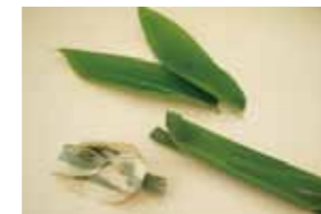
代表的な遊びのひとつ、笹舟。