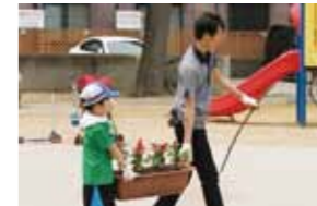
完成したプランターを公園内にバランスよく配置。