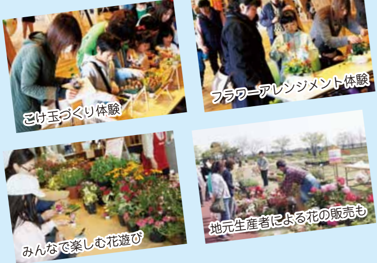
フラワーアレンジメント体験