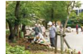
桜の木の下にもサルビアを植えて彩りを添えます。