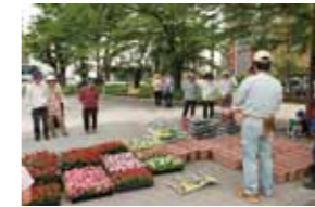
朝10時に集合して全員で段取りを確認。38人も集まりました。