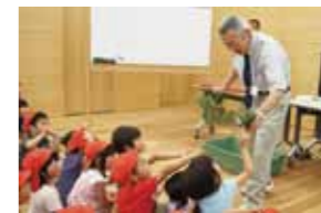
さあ、マツの葉を使って、となりの子とすもうをしてみよう!