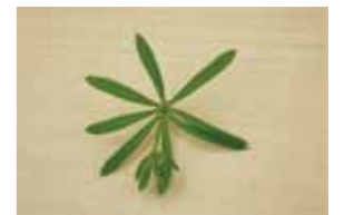
すもうで勝ったら、ヤエムグラのプローチをプレゼント。