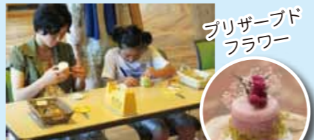
プリザーブドフラワー