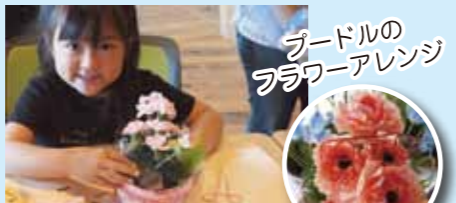
ブードルのフラワーアレンジ