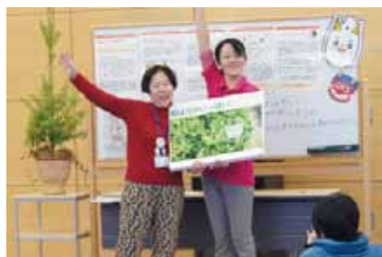
落花生はどこに実ができるのかな？

2/1に節分イベントを開催しました。「節分ってなあに？」と「落花生のおはなし」で行事の成り立ちや、落花生の不思議について楽しく学んだ後に、主役の鬼が登場。こわい顔の鬼にびっくりしながら「鬼は外！福は内！」と元気いっぱい豆まきをして春の訪れを祝いました。