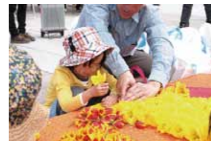
ボードに花を挿していきます。