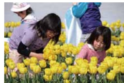
生産者の畑で花を摘みます。

新潟の春を彩る花絵の制作は市民団体「にいがた花絵プロジェクト」が行っています。球根育成のために摘まれてしまう花を使うこの活動は全国各地にも広がり、使われる花の数はなんと約80万本！生産者へのエールや地域活性にも役立っています。今年のメイン花絵は4/29に新潟駅南口中央広場で開催されます。