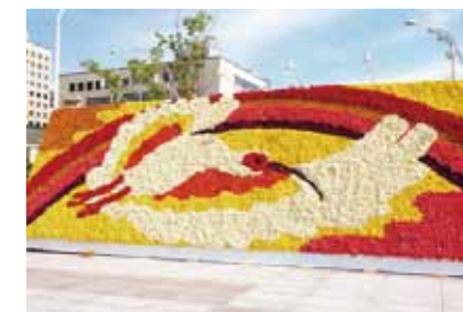
2013年のメイン花絵はトキでした。