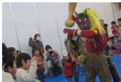
鬼が登場すると、みんな大興奮！