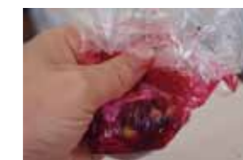
小さい子どもでも楽しめます。