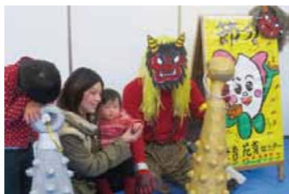
最後は鬼と仲良く記念撮影