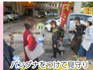
バンダナをつけて見守り