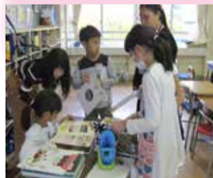
新潟「じまん」を学習中

子どもたちが地域に愛着と誇りをもって健やかに育ち、地域のつながりが紡がれていく一助となれば幸いです。