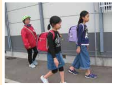
有明台コミ協による見守り活動(ひまわりクラブを利用する児童の帰宅支援)