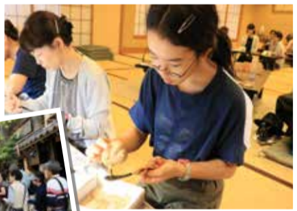
かき正はなれでの伝統工芸体験