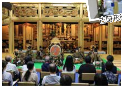
勝楽寺での雅楽演奏会