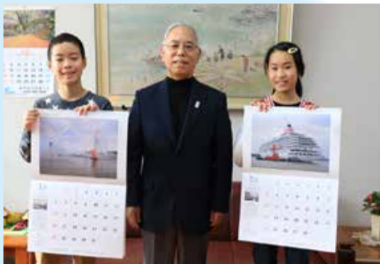
鏡淵小学校の子どもたちに外内座長(写真中央)よりカレンダーを贈呈(各クラスに掲示予定)

日頃、何気なく目にしている新潟西港の美しい風景や港で活躍する船舶、開港から現在までの歴史などに興味を持っていただき、今後の新潟市の発展・繁栄を考える機会となることを願っています。