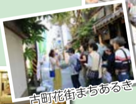
古町花街まちあるき