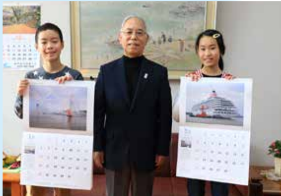
鏡淵小学校の子どもたちに外内座長(写真中央)よりカレンダーを贈呈(各クラスに掲示予定)

日頃、何気なく目にしている新潟西港の美しい風景や港で活躍する船舶、開港から現在までの歴史などに興味を持っていただき、今後の新潟市の発展・繁栄を考える機会となることを願っています。