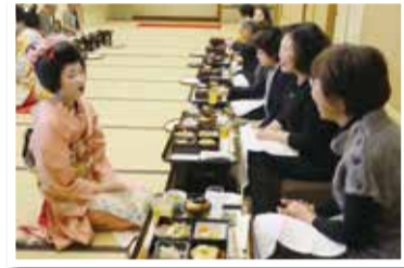
芸妓さんと楽しく会話

新潟を代表する老舗料亭の昼食を味わいながら、古町芸妓の舞を鑑賞する企画「料亭の味と芸妓の舞」を開催します。芸妓さんとの会話や、写真撮影を楽しむこともできます。家族や友人と一緒に、伝統ある新潟のおもてなし文化を堪能しませんか。