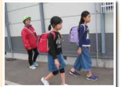
有明台コミ協による見守り活動(ひまわりクラブを利用する児童の帰宅支援)