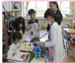
新潟「じまん」を学習中

子どもたちが地域に愛着と誇りをもって健やかに育ち、地域のつながりが紡がれていく一助となれば幸いです。