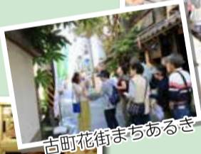
古町花街まちあるき