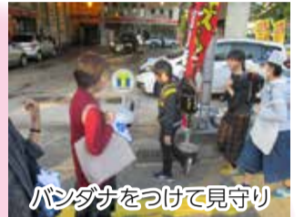
バンダナをつけて見守り

今年度は、白山小学校こども見守り隊による「地域みんなが見守り隊」事業と、新潟青陵大学の学生グループと浜浦小学校3年生による「新潟まんたんけんたい」事業の2事業について、当部会が「協働の要」として学校や関係機関の調整役・助言役となりながら進めています。