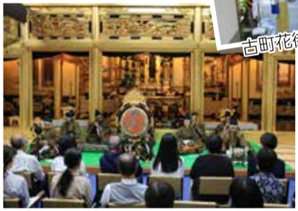
勝楽寺での雅楽演奏会