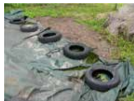
古タイヤやビニールシートは処分する、もしくは穴を開けるなどして、雨がたまらないように工夫しましょう

一般家庭に多く見られる発生源の代表例です。日常的に整理整頓し、たまった水をなくすことが重要です。