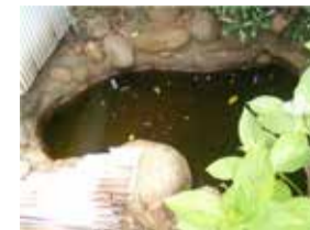
蚊の幼虫(ボウフラ)は魚の餌になります。池には魚を飼育しましょう