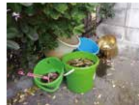
使用していないバケツは裏返し、日常的に使用しているものはこまめに清掃して水を替えましょう