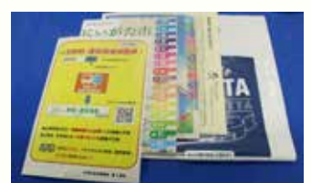
転入者へお渡しする手提げ袋に同封

バス時刻・運賃検索チラシ =写真左=を作成し、転入者への案内強化や公共施設等でPRを行う予定です。