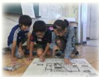
活動イメージ (上所小学校 防災教室の様子)

また、地域の歴史をガイドから紹介してもらい歴史・文化について触れることで地域への愛着・誇りづくりにつなげます。実践を踏まえ、どの学校の防災教室でも活用できるようなモデル事業を目指しています。