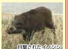
目撃されたイノシシ