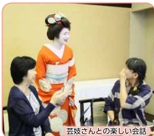
芸妓さんとの楽しい会話