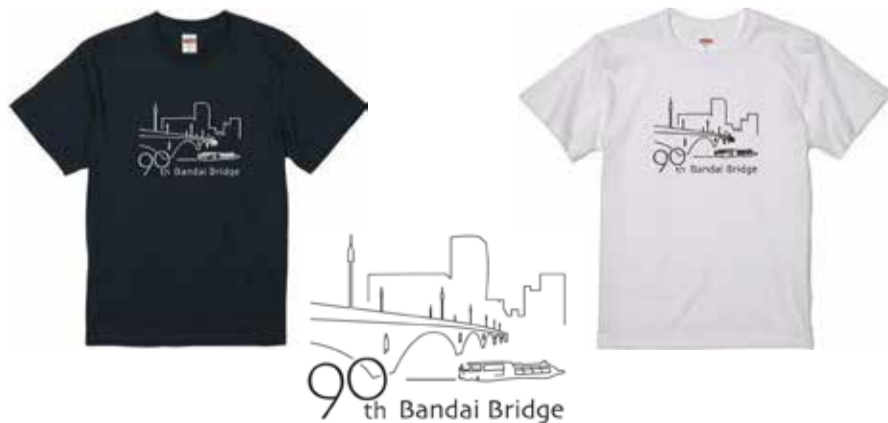
昨年の採用デザインとTシャツ

新潟市のシンボルであり、国の重要文化財である3代目萬代橋の生誕を祝うイベント「萬代橋誕生祭」の開催を記念して作成する「萬代橋Tシャツ」のデザインを募集しています。萬代橋に思いをはせて、応募してみませんか。