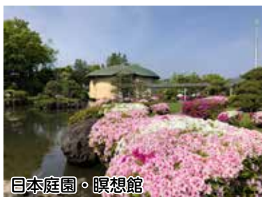
日本庭園・瞑想館